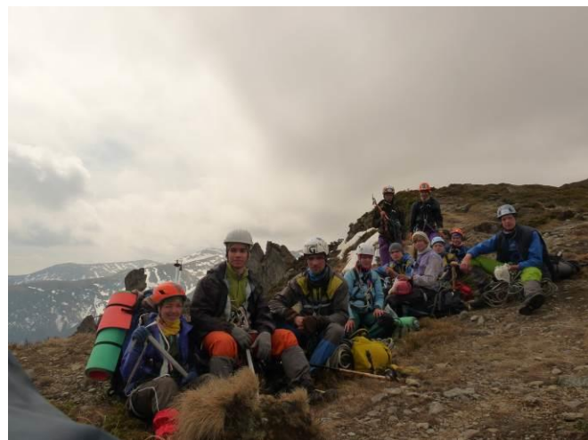
Фото 6 Група на сідловині перевалу