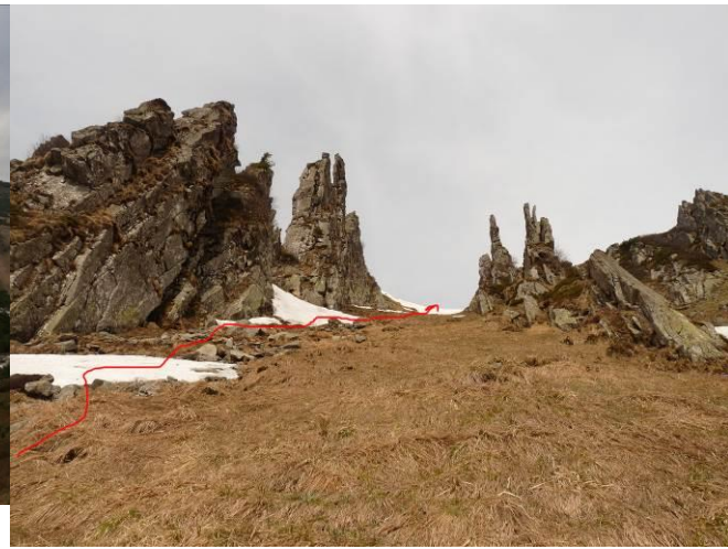
Фото 2 Перевальний злет (260)