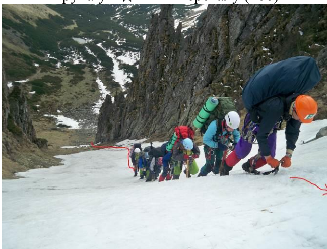
Фото 5 Рух групи з самостраховкою