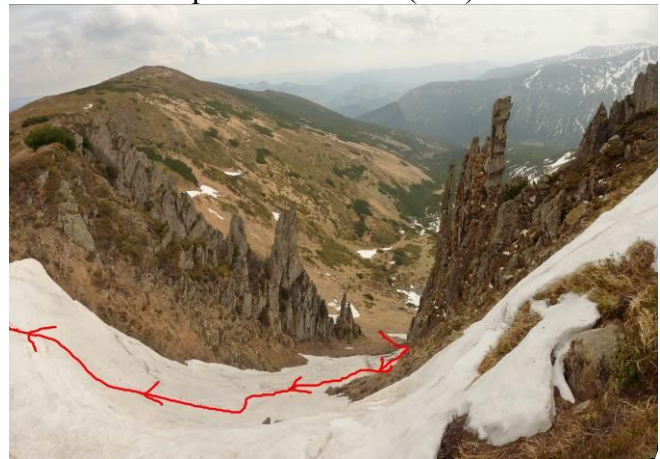
Фото 4 Вид згори на перевальний злет (275)