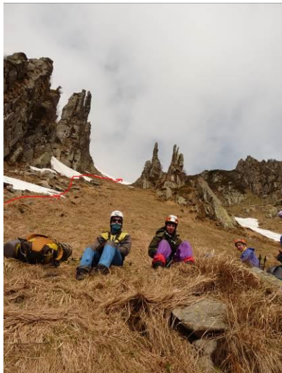
Фото 3 Група у підніжжя перевалу (266)